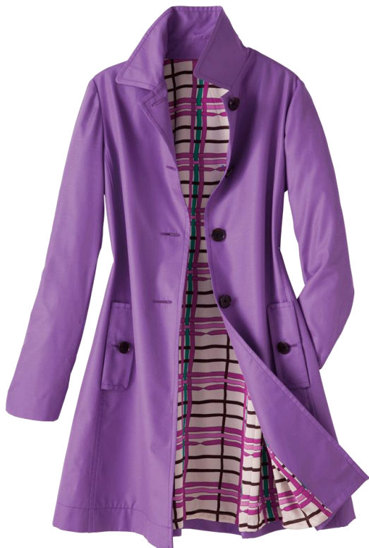
カラー：ラベンダー

日本人の約4人に1人が悩まされているという花粉症。「花粉ガード・ステンカラー・コート」は、その花粉をガードする「ポルテクト（*注1）」加工を採用、糸と糸の間を非常に細かい粒子の特殊樹脂で埋めることにより、花粉が繊維の表面に付きにくく、また付いた花粉もコートの表面を払うだけで落ちやすく致しました。DoClasseの得意とする、40-50代の女性の洋服に対する悩みをカバーする「デザイン」と、花粉ガードという「機能性」の両方を兼ね備えたことで、辛い季節を美しく乗り切るスプリングコートとなりました。今年は花粉に付着した放射性物質も気になるところ、付着した花粉の屋内への持ち込み防止が期待できます。