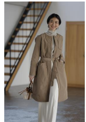
マジカルサーモ・グログラン C カラーコート