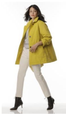
マジカルサーモ・グログランショートステンコート