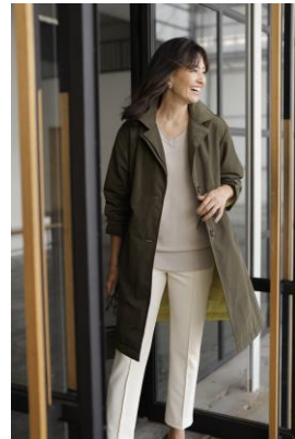
マジカルサーモ・グログランミドルコート