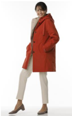
マジカルサーモ・グログランフードコート

機能性も美しいシルエットも兼ね備えたDoCLASSEのアイテムで、寒い冬も着膨れを気にせずオシャレをお楽しみください。