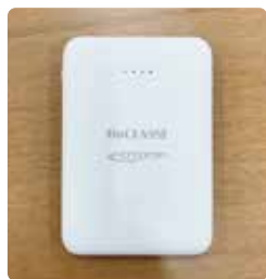
モバイルバッテリー