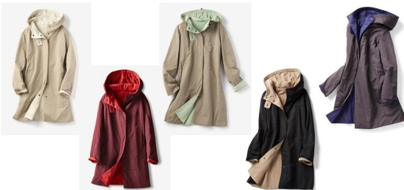
(左から)ストーン、バーガンディー、ダークトープ、ブラック、チャコール