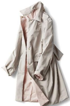
マジカルサーモ・リバーシブルステンカラー

シックにもカジュアルにも着こなせる、ジップアップデザインのフードコート。流行中のマウンテンパーカーのニュアンスを取り入れた、トレンド感のある大人のカジュアルアウター。