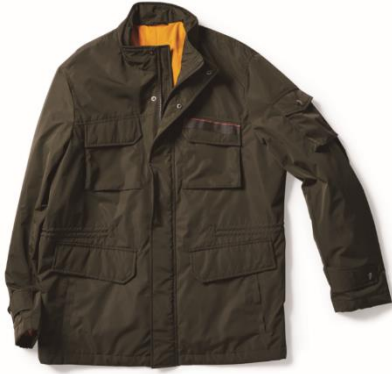
▲マジカルサーモ・M65 ブルゾン

Doクラッセのメンズでは人気アイテムのジャケットM65と、幅広い年代に愛されるステンカラーコートが今年はマジカルサーモと合体しました。M65は袖口のストラップ付きでデザインのアクセントになるだけでなく、袖口の太さの調節も可能です。ステンカラータイプのコートは、表面をウール生地にした高級感のあるリバーシブルコートと、両面ポリエステルタフタ生地の2タイプが新登場し、どちらも裏表の2通りの着こなしが楽しめます。