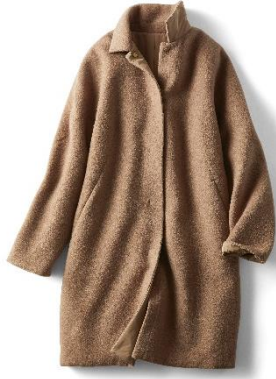
(仮)マジカルサーモ・リバーウール/ステンカラー