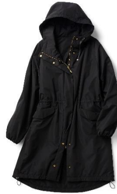
マジカルサーモ・カジュアルフードコート

どんな肩幅の人にも合いやすいドロップショルダー。脇の下にマチを入れることで、稼働域を広げている。表裏ともボタンが見えないきれいめデザイン。