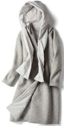
(仮)マジカルサーモ・リバーウール/ノーカラー

女性らしい小ぶりな衿デザイン。今っぽいシルエットで、肩幅も問わない、ドロップショルダー。裏面はキルティングと横ポケットで優しい印象。クタツとならない中綿入り。ベルト通しは高めに配置しスタイルアップ。