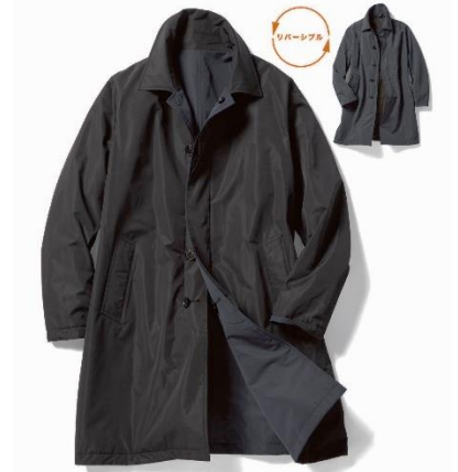
▲マジカルサーモ・リバーシブルコート