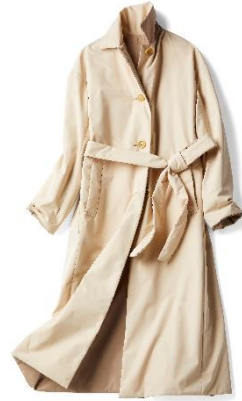
マジカルサーモ・リバーシブルトレంచి

ややコクーンシルエットのため、ボリューム感のあるボトムスでもコート裾でいったんくびれが生まれ、スタイルアップして見える。エレガントにもスタイリッシュにも着られる