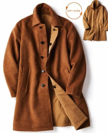
▲マジカルサーモ・リバーシブル・ウールコート